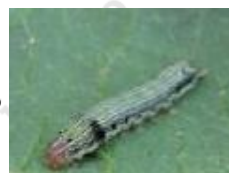
シロイチモジヨトウ

・成虫は卵塊で(数百個)で産卵する ・幼虫は背中に1対の黒い斑紋がある ・食欲旺盛で集団で食害を起こす